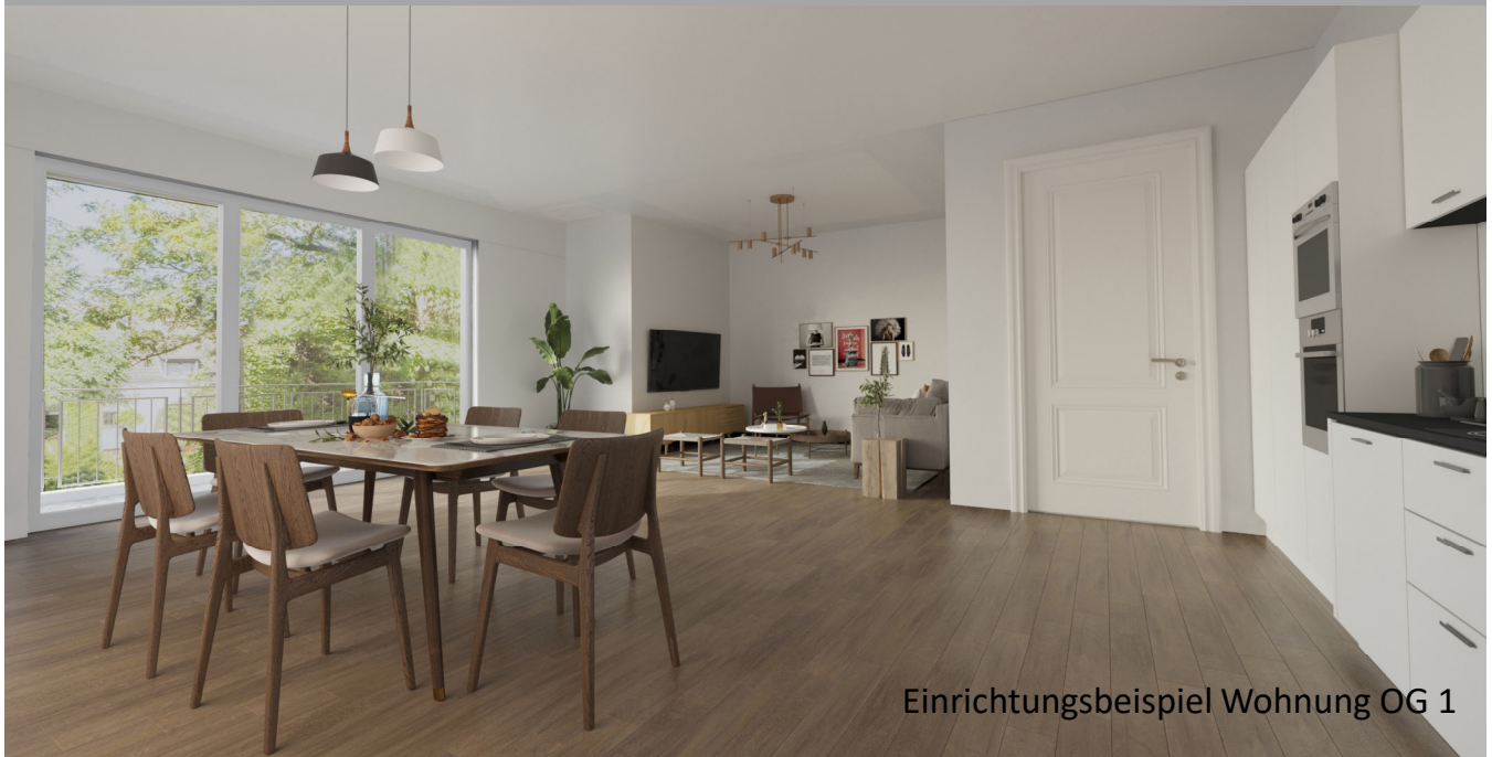
Einrichtungsbeispiel Wohnung OG 1