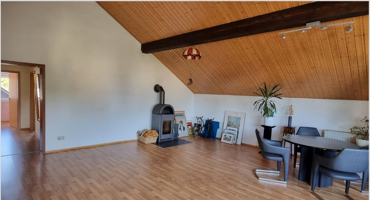
Wohn-/ Esszimmer 2