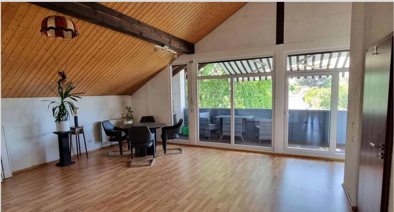
Wohn-/ Esszimmer 1