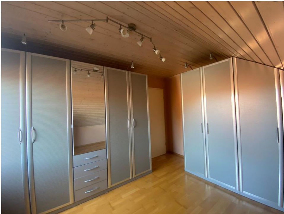
Schlafen DG 2